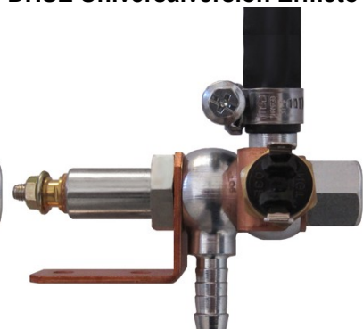
DHSE Universalversion Ermeto

Einbau vor dem Filtereingang in die Kraftstoffleitung PA-/Stahlleitung mit AD 08/10/12mm